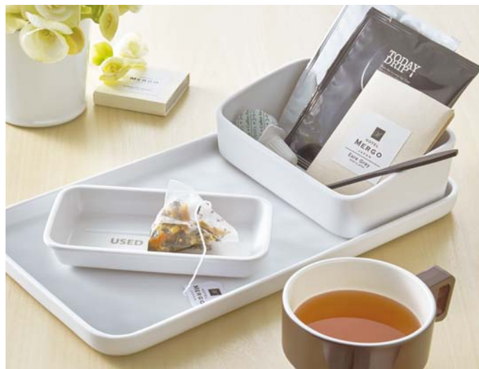
●使用製品/ドリップバッグ入れ(M717IW)・ドリップバッグトレー(M718IW)・トレー 中(M702IW)・柄付カップ(C38GB)