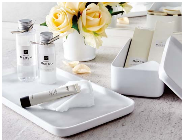
●使用製品/トレー 中(M702IW)・アメニティボックス(M708IW)・トレー 小(M701IW)

やさしく清潔感あふれる癒しのカタチ。マット調の上品な“白”は、ベッドサイド、サニタリーなど場所を選ばずフレッシュな印象を与えます。